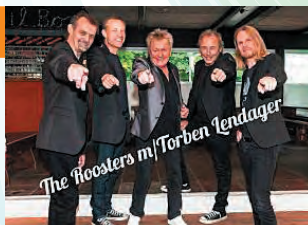
The Rooster